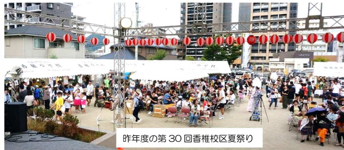
昨年度の第30回香椎校区夏祭り