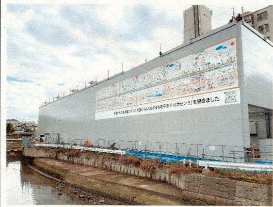
発進立坑（防音ハウス）

発進立坑(防音ハウス)に展示している巨大アート(壁画)は、香椎小学校の子どもたちが描いた絵です。